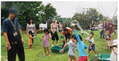
※プログラムの情報はあねっとLINEで配信しています。右頁のQRコードからまたは登録してください。

毎週水曜日、館内が比較的静かな時間に、親子で遊ぶ「トコトコプログラム」を実施しています。主に3歳までの未就園の子どもと保護者を対象にした遊びのプログラムです。この頃の子どもたちにとって、遊びは生きることそのものの、身近な「もの」や「こと」を中心にして、見る、聞く、触るなど感覚を使う遊びを中心にしています。白い大きな紙の上で全身絵の具をまみれになる「えのくであそぶ」、外に出て季節ごとの空をのぼる「みつける・あそぶ」、いままでもさわって遊んでいたくなる「みずであそぶ」「土であそぶ」、ドミノの出発前のリズムを楽しむ「音であそぶ」など毎週プログラムは変わります。今年の夏は対象も小学生未満の子どもまで広げたスペシャルバージョンもありました。その日の体調や気持ち、リズムによっては、集団で遊ぶことは難しくたりすることもあります。子どもに寄り添いながら、その子のペースに合わせて遊んでください。場合によっては、一緒に参加しているお父さん、お母さんたちが楽しんでくれるのもとても良いです。愛知児童総合センターは「大人が楽しい子どもはうれしい」を合言葉にしていますから。