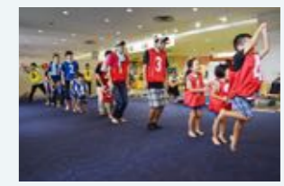
イクメンキレター養成事業「お父さんと運動会」