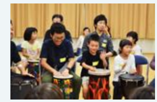
イクメンキレター養成事業「ドラムサークルであそぶ」