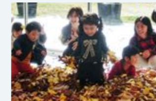
トコトコプログラム「はっぱであそぶ」

対象：1歳から3歳の未就園の子どもとその親 定員：15組程度 参加費：無料(入場料300円が必要) 受付：プログラム開始30分前から 1Fインフォメーションにて先着順 ※受付時刻に参加希望者が定員以上の場合は抽選