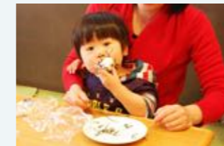
トコトコプログラム「たべるあそび」