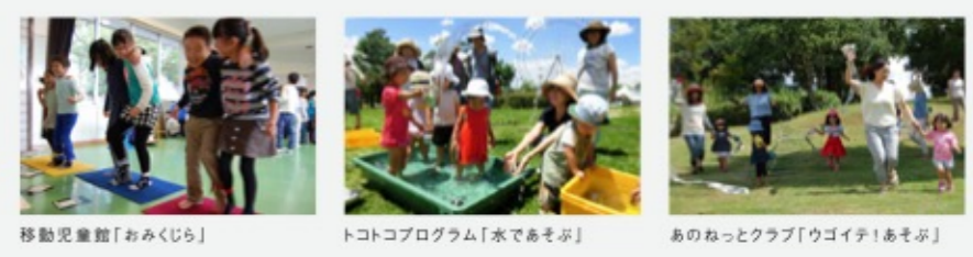
移動児童館「おみくじ」 トコトコプログラム「水であそび」 あのねっとクラブ「ウゴイテ!あそび」

基本的に大切に思われ、愛されていれば、子どもたちは案外強いものです。お母さんの小言も耳にタコを作りながらやり過ごしていきます。 むしろ、そうやって悩みながら子育てをしていく過程が大切なのかもしれません。「怒鳴ってしまったごめんね。」「お母さんイライラしてた、悪かった」と、自分の至らなさを認め、詫言ながら子どもたちと向き合う。お互い未熟な人間として成長していくことと努力することが尊いことのように思います。