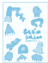
谷川俊太郎+たれかどれか 「なんだかうれしい」(福音館書店)