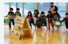
移動児童館 「チャレンジマーケット」

時間：10:30-12:00 場所：愛知県児童総合センター 対象：2歳半～3歳の子どもと親(平成23年10月～平成25年3月生まれ) ※5回連続のプログラム全てに参加できる方。(第3回はお父さんも参加) 定員：各コース15組 託児あり：5組(希望者多数の場合は抽選) 託児なし：10組(希望者多数の場合は抽選) 参加費：無料(入場料300円が必要) 申込方法：電話にて受付 受付期間：7/1(水)～7/31(金) ※受付時間9:00-17:00 参加のお知らせは、郵送にてご連絡いたします。(参加決定者には必要書類も同封いたします。)