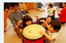
あのねっとクラブ 「音」であそぶ

子どもと保護者を対象にしたあそびのクラブです。わくわくするような感覚あそびを中心に親子で楽しく遊ぶ5回連続の講座です。全5回をとおして、親にとっては子どもの新しい姿を発見すること、ほかの親との交流を深めることができ、子どもにとっては人や場に親しみ思い切り遊ぶ体験の場となります。第3回は、お父さんも参加するプログラムになります。家族みんなで楽しんでください。