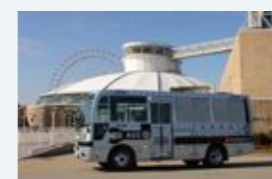
移動児童館 「ゆめたま号」

○すいすいコース 9/9(水)・9/16(水)・9/23(水・祝)・9/30(水)・10/7(水) ○もくもくコース 9/10(木)・9/17(木)・9/26(土)・10/1(木)・10/8(木)