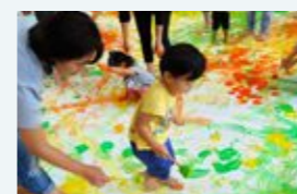
トコトコプログラム 「えのぐ」であそぶ

第1回「ウゴイテ!あそぶ」 第2回「ヘンシン!であそぶ」 第3回「パパのクッキング!タイム+ママのジブンジャン」 第4回「えのぐ!であそぶ」 第5回「音」であそぶ