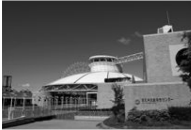
編集・発行/愛知県児童総合センター(財団法人愛知公園協会)

愛知県児童総合センターは「遊び」をテーマにした県立大型児童館です。1996年の開館以来、子どもと大人がともに、心と身体をフルに活用して遊ぶことで、新しい気づきが実感できる時間と空間を提供しています。また、遊具や遊びのプログラム開発、よりよい児童環境のためのネットワークづくり、セミナー・研修、調査・資料収集、移動児童館など多岐にわたる活動を行っています。